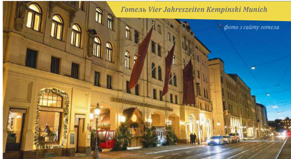
Готель Vier Jahreszeiten Kempinski Munich

– Побачимо, що можна організувати, – сказав мені люб'язний директор Таллінського зоопарку. – Сьогодні я подзвоню журналістам, яких може